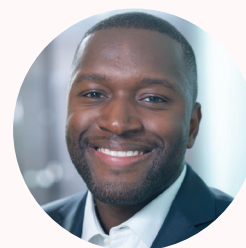
Eric Naxicap Partners