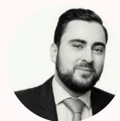
Samuel Rothschild & Co