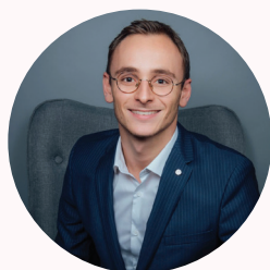
Cantin BNP Paribas